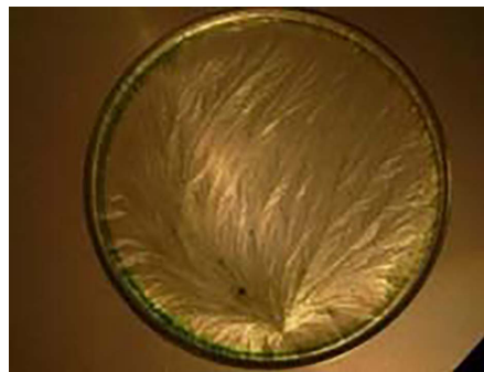
Figure 1a - Carotte conventionnelle