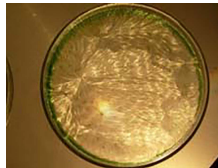
Figure 1b - Carotte biologique

Cet examen a permis de mettre en évidence les meilleures méthodes de culture et de conservation des aliments, ainsi que leur meilleur mode de cuisson. Ainsi, on peut voir que l'agriculture biodynamique est la meilleure des agricultures bio, elle-même meilleure que l'agriculture utilisant des produits chimiques. On peut voir aussi que la congélation détruit la vitalité des aliments.