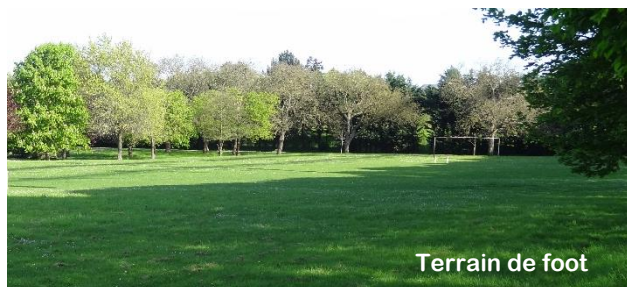
Terrain de foot

Le grand parc arboré de la communauté est d'accès libre, ainsi que le terrain de foot. Des tables et chaises d'extérieur sont disponibles en été.