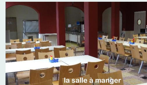
la salle à manger

L'établissement est accessible aux personnes à mobilité réduite. Il est équipé de chambres PMR.