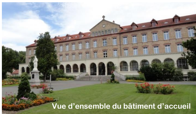
Vue d'ensemble du bâtiment d'accueil