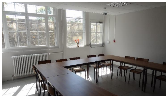
Des salles modulables en fonction des besoins