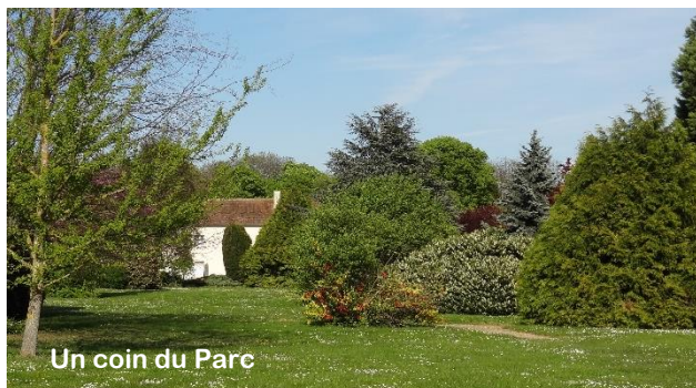
Un coin du Parc